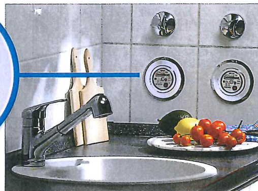
Die optimale Lösung, immer im Blick: der Einbauzähler unter Putz