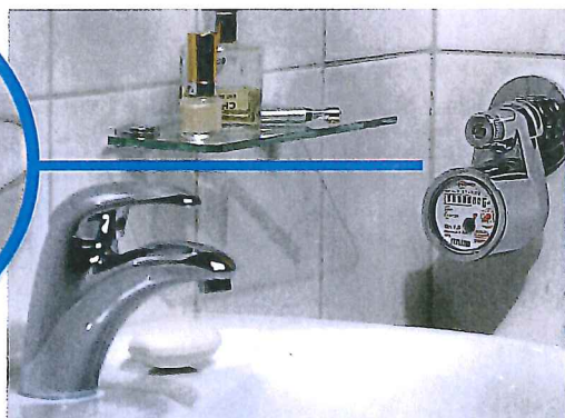
Die minimale Lösung: der Ventilzähler